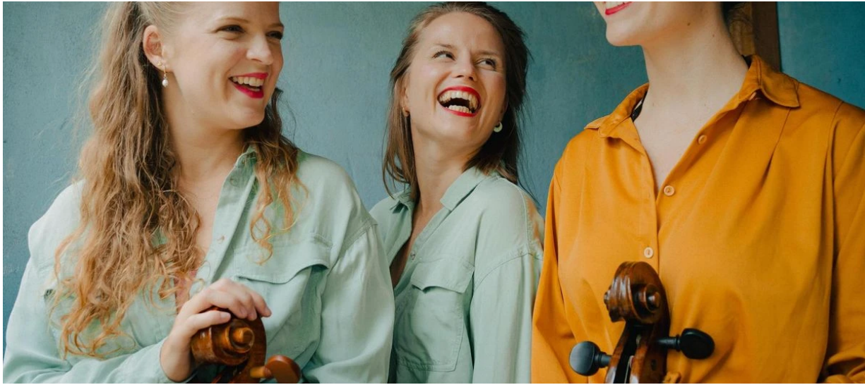
Das Gambentrio tiefsaits.